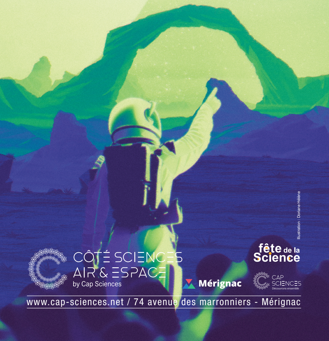
Illustration : Doriane Héline